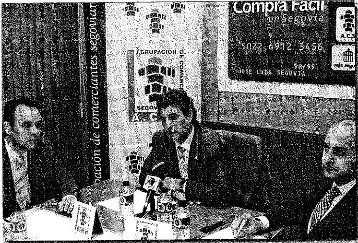
Un momento de la presentación de la campaña en sede de ACS.